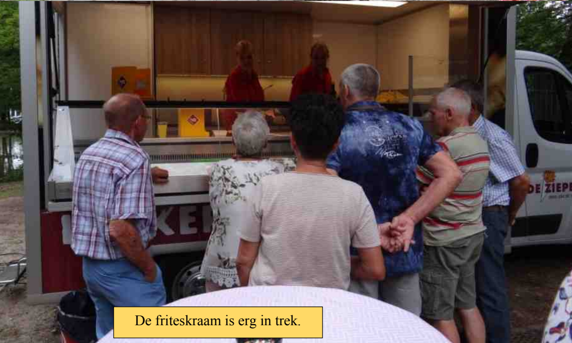
De friteskraam is erg in trek.