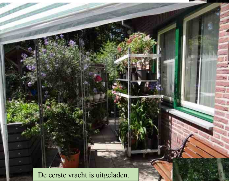
De eerste vracht is uitgeladen.