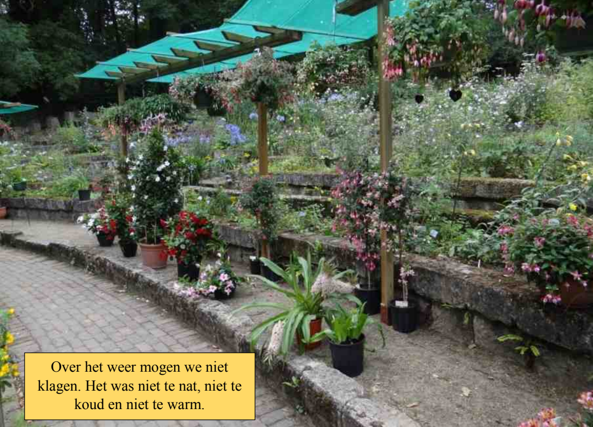
Over het weer mogen we niet klagen. Het was niet te nat, niet te koud en niet te warm.