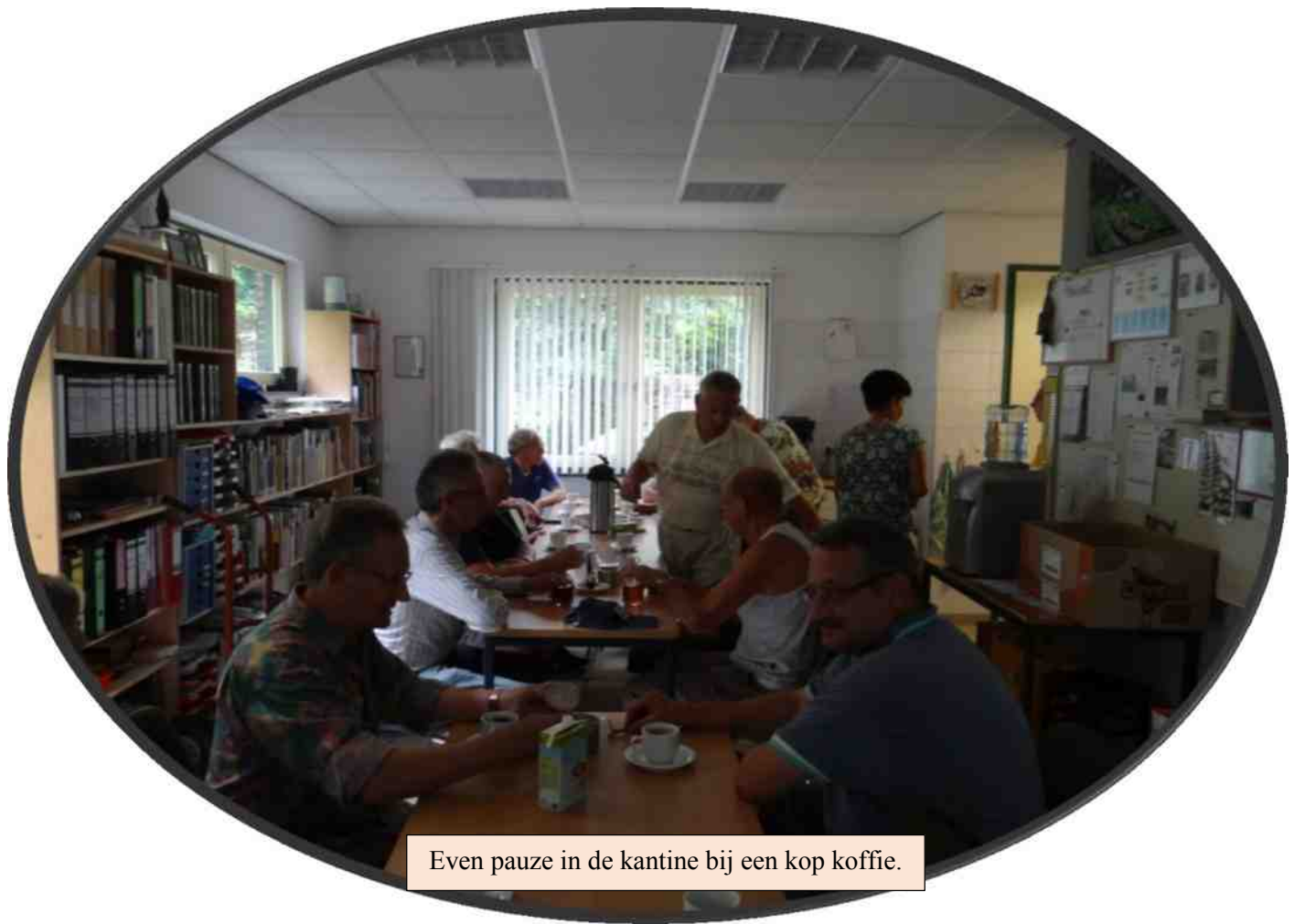
Even pauze in de kantine bij een kop koffie.

De evaluatie moet nog volgen, maar het hele gebeuren heb ik geprobeerd vast te leggen in een fotoreportage in deze CultiVaria. Hopelijk roepen de foto's plezierige herinneringen op en wordt het werk dat in de organisatie is gestoken naar het tweede plan geschoven.