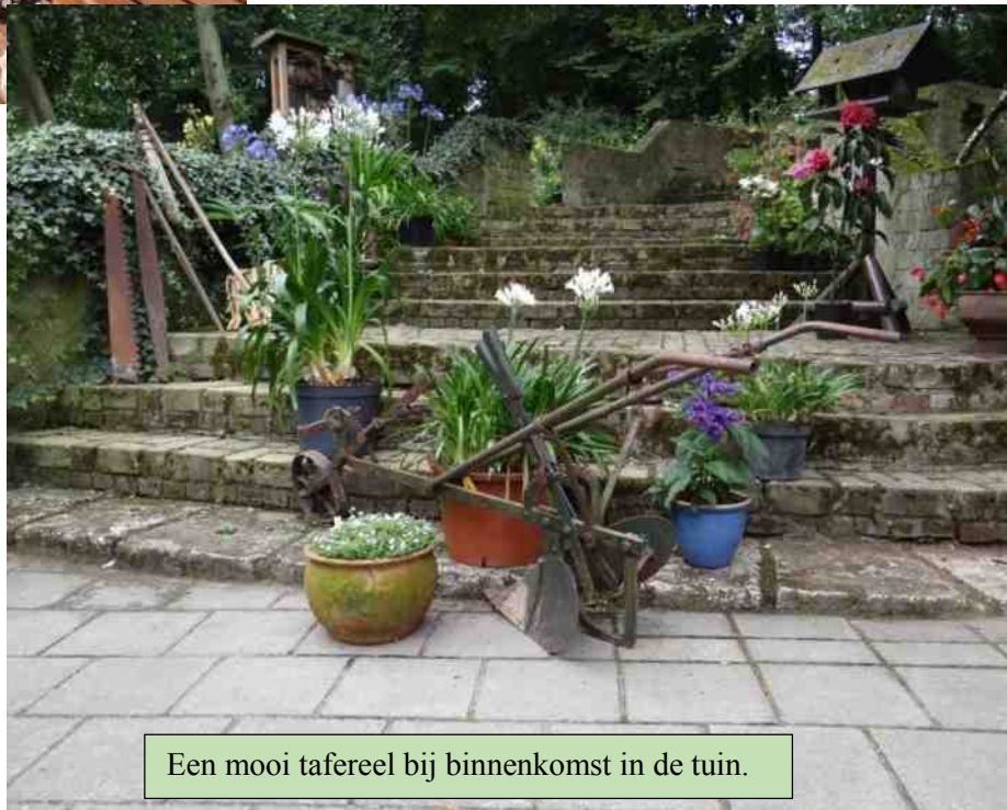
Een mooi tafereel bij binnenkomst in de tuin.