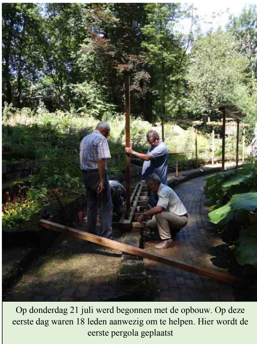
Op donderdag 21 juli werd begonnen met de opbouw. Op deze eerste dag waren 18 leden aanwezig om te helpen. Hier wordt de eerste pergola geplaatst

Op de zaterdagavond was een gezellig samenzijn gepland en het was echt gezellig. Deze keer geen uitgebreid culinair buffet, maar gewoon een frietje met halen bij de friteskraam. Ook dat was weer eens iets anders en het was bovendien ook nog een succes. Alles heel gewoon, zoals de hele vereniging heel gewoon is.