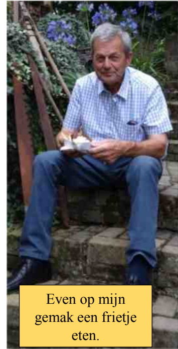
Even op mijn gemak een frietje eten.