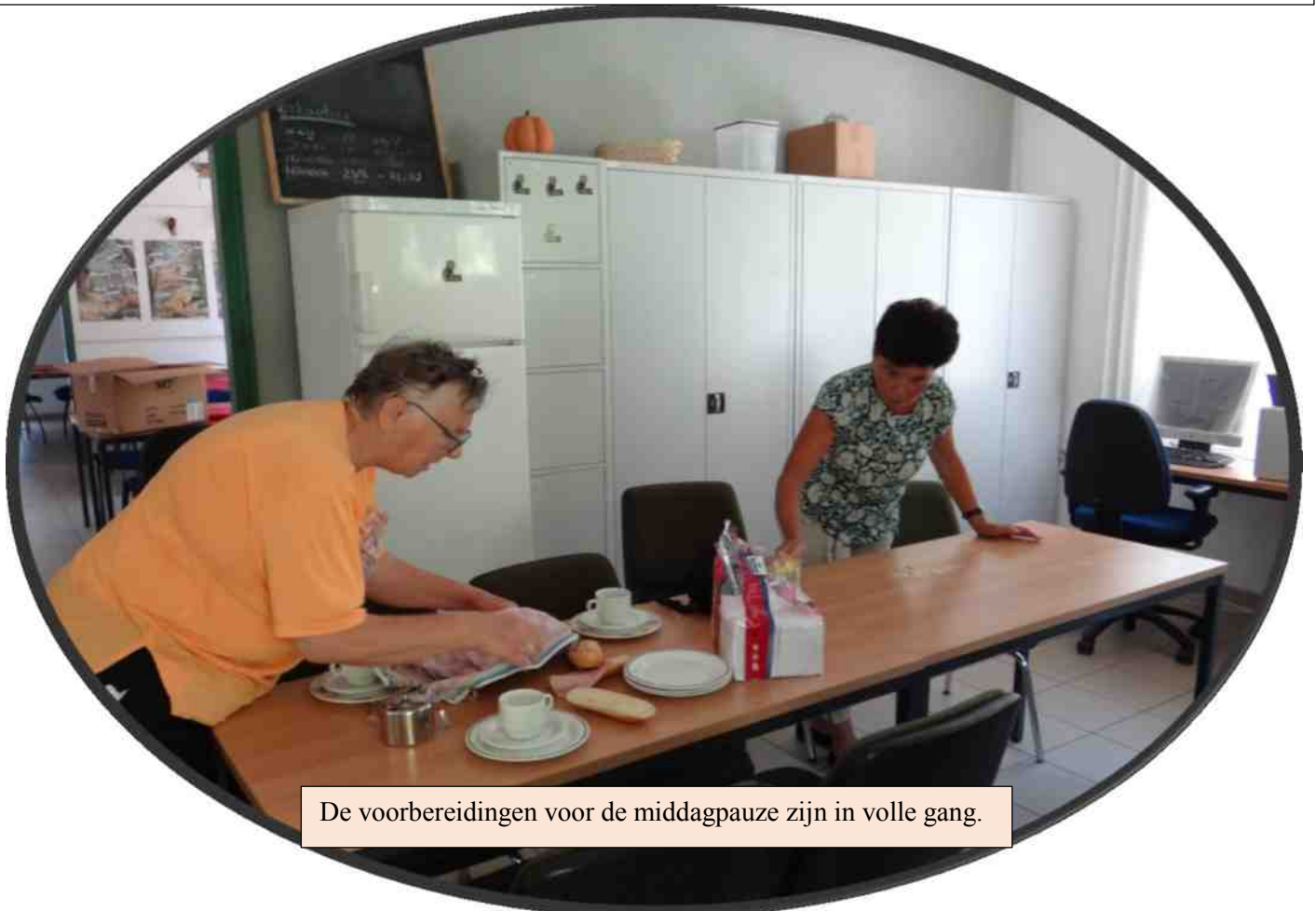
De voorbereidingen voor de middagpauze zijn in volle gang.

De evaluatie moet nog volgen, maar het hele gebeuren heb ik geprobeerd vast te leggen in een fotoreportage in deze CultiVaria. Hopelijk roepen de foto's plezierige herinneringen op en wordt het werk dat in de organisatie is gestoken naar het tweede plan geschoven.