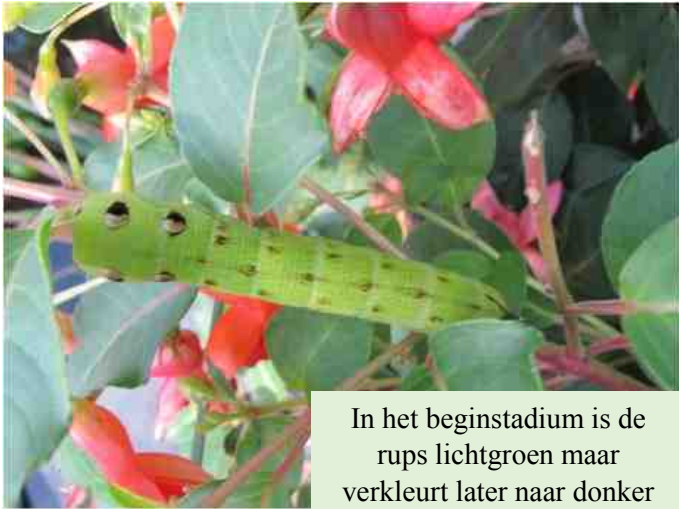
In het beginstadium is de rups lichtgroen maar verkleurt later naar donker bruin.

De foto's zijn mooi en de rupsen ook, maar.....ze vreten je hele fuchsia kaal. Het zijn de rupsen van het Groot Avondrood en ze zijn enorm vreetlustig. Dus zo snel mogelijk verwijderen. Gelukkig komen ze niet in grote aantallen voor en kun je ze wegvangen.