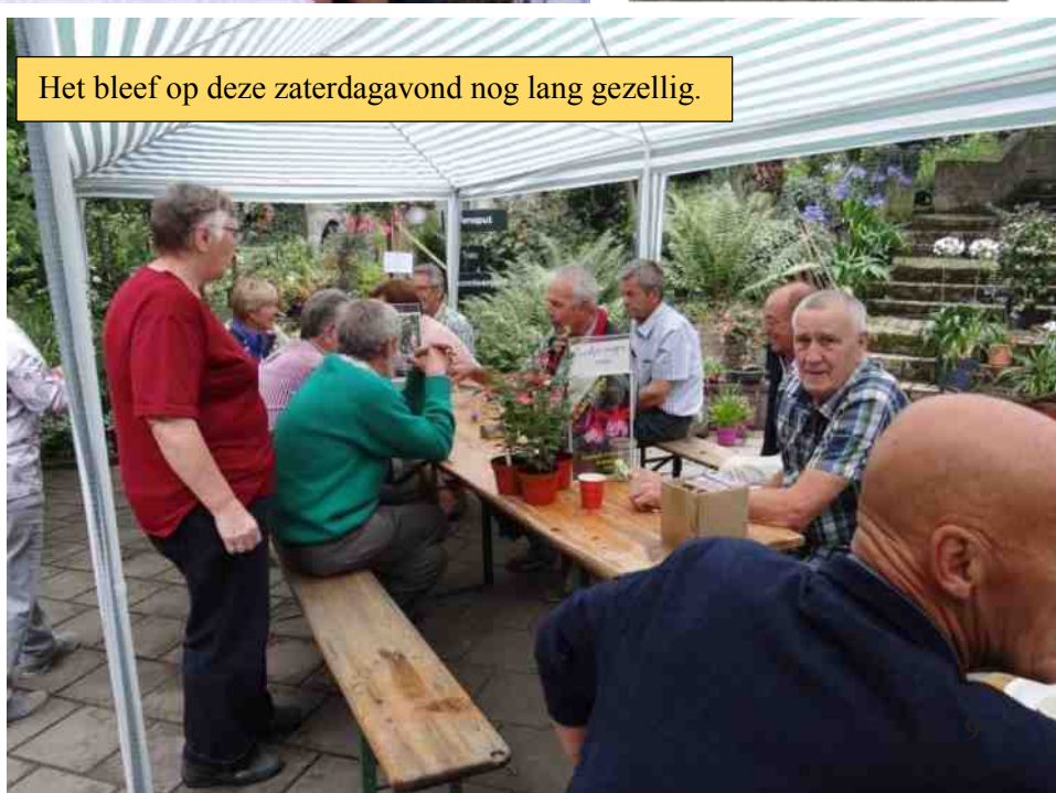
Het bleef op deze zaterdagavond nog lang gezellig.