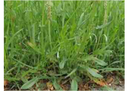
Bladeren van Schapenzuring.