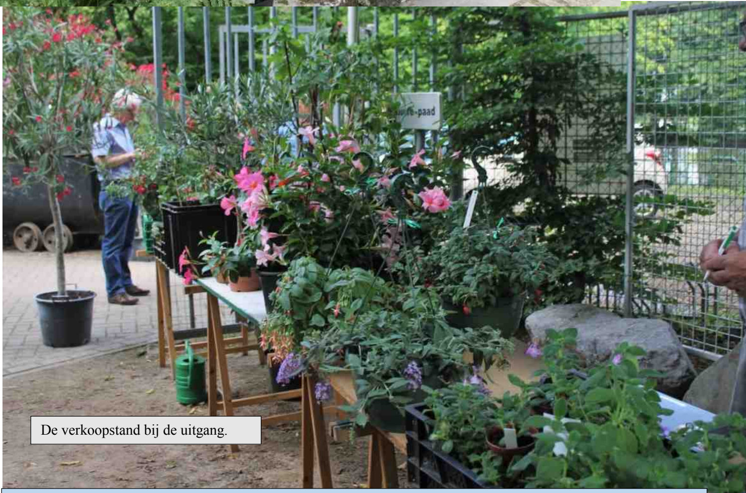
De verkoopstand bij de uitgang.

In de IVN-tuin te Stein werden ongeveer 250 planten tentoongesteld. Het betreft fuchsia's en cuipplanten. Het is slechts een heel klein gedeelte van de fuchsia's en cuipplanten die er op de wereld bestaan. Neem de fuchsia. Deze is pas sinds 1696 bekend. De soort werd gevonden door Charles Plumier die de plant ontdekte in Santa Domingo, op dit moment Dominicaanse Republiek geheten. Hij noemde de plant naar de Duitse botanicus Leonhard von Fuchs. In de negentiende eeuw was de plant geliefd in Europa en sindsdien kent de plant ups en downs. Ook de cuipplanten werden pas bekend na de ontdekkingsreizen. Ze werden door ontdekkingsreizigers meegebracht uit warmere streken en pas nadat men een overwinteringsmogelijkheid gemaakt kon men deze planten ook in koudere omstandigheden cultiveren. Toch beleven ook deze planten hun ups en downs.